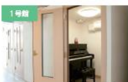
1号館 ピアノ練習室1 こども教育専攻のピアノ実技で使用。授業が行われていない時間は自由に練習することができます。