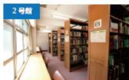
2号館 図書館 約30,000冊の蔵書があり、新着図書も充実しています。