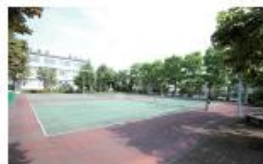
テニスコート クラブ活動はもちろん、ラケットなどの貸し出しもしているので勉強の合間にリフレッシュすることができます。