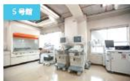
5号館 生理学実習室 臨床検査専攻の生理学的検査の実習で使用。心電図、脳波、超音波などの生体検査について学びます。