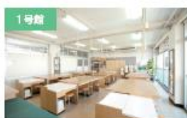
1号館 被服実習室 生活文化コースのアパレルデザイン実習で使用。縫製の基本技術から、センスを活かした服の製作までを行います。