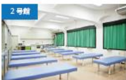
2号館 実習室 柔道整復専攻の実習で使用。ギプスやテーピングなどの治療技術を学びます。