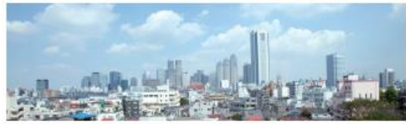
新宿副都心 1号館屋上から撮影。晴れた日の景色は最高です。すてきな夜景も一望できます。