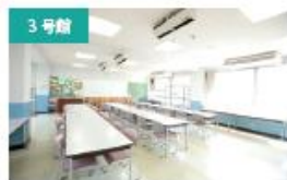
3号館 給食の運営と管理実習室I(食堂) 食物栄養専攻の給食管理実習で使用。栄養士の仕事の流れを学びます。