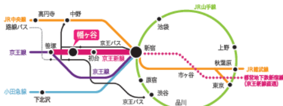
都営地下鉄新宿線乗り入れ京王新線「幡ヶ谷」駅下車 北口徒歩7分