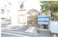
帝京接骨院 柔道整復専攻の臨床実習で使用。患者さんとのコミュニケーションの取り方や治療方法について学びます。