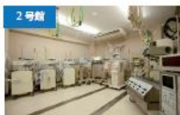
2号館 臨床工学実習室 専攻科臨床工学専攻の実習で使用。人工心臓装置、人工呼吸器、血液浄化装置などを完備しています。