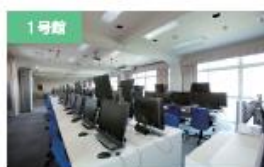
1号館 コンピュータ演習室 23インチ大画面パソコンが計84台。スクリーンとモニターで講師の作業画面などを確認しながら講義を受けることができます。