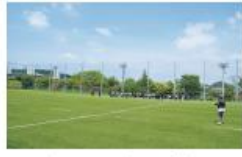
百草グラウンド (日野市) 多目的グラウンド(人工芝)としてさまざまな用途で利用しています。