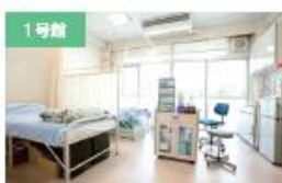
1号館 保健室 ケガや病気に対する応急処置はもちろん、健康、心に関する相談なども受け付けています。