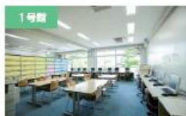
1号館 学生支援室 パソコンの利用や就職活動報告書、求人票の閲覧ができます。