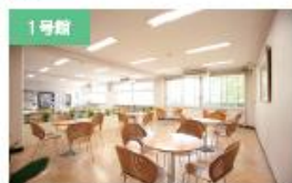
1号館 学生ホール 自習、ランチ、歓談など、自由に使用することができます。