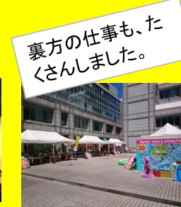
裏方の仕事も、た くさんしました。

↓8月11日(土) せせらぎ花火鑑賞会に ボランティアで参加しました。 今年で20回を迎える地域の神宮花火鑑賞会です。