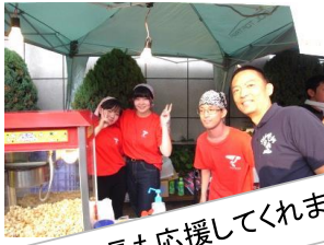
渋谷区長も応援してくれました。